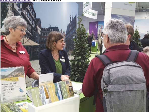
Messestand des Biosphärengebiets auf der CMT in Stuttgart

Weitere Informationen zur Zusammenarbeit mit zertifizierten Partnerinnen und Partnern innerhalb der Partner-Initiative des Biosphärengebiets und mit weiteren Akteuren in der Region im Sinne einer nachhaltigen Regionalentwicklung sind online unter https://www.biosphaeren-gebiet-alb.de erhältlich.