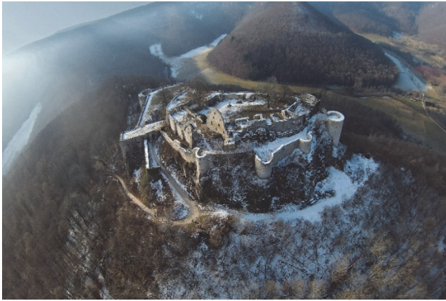
Foto: Der Hohenurach im Winter.