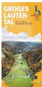
Bild: Titel Flyer Großes Lautertal