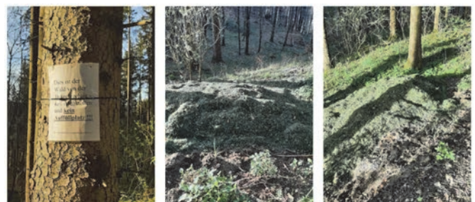
Reinhold Teufel Bürgermeister