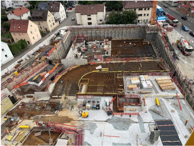
Fotos: Blick auf die Baustelle von einem Kran aus.