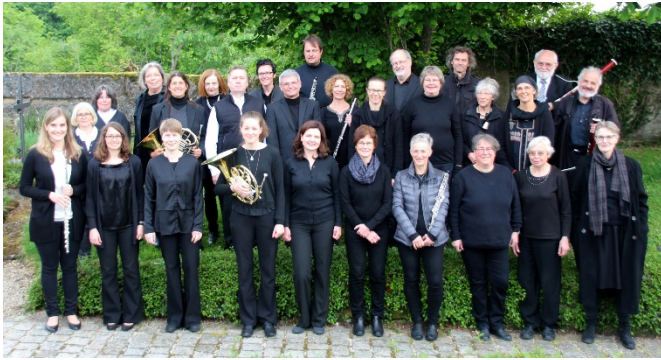
Orchester der Martinskirche Münsingen