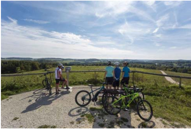
Fahrradfahrer im ehemaligen Truppenübungsplatz Münsingen, Foto: rathay, Touristik Info Münsingen