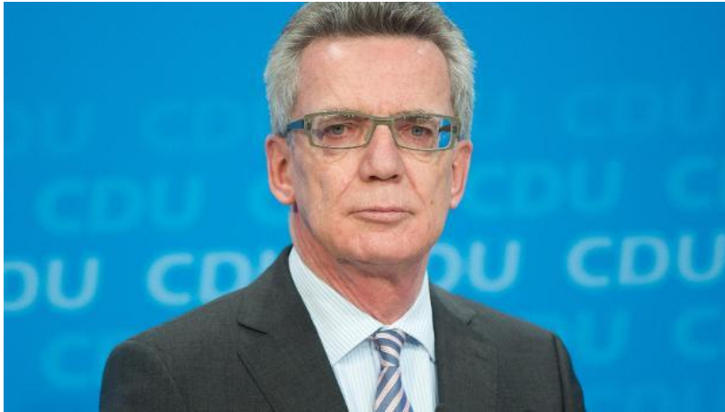
Bundesinnenminister Thomas de Maizière MdB

Bundesinnenminister Thomas de Maizière kommt am 03.03.2016 nach Pfronstetten!